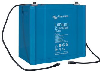
12,8 V 60 Ah LiFePO 4 Batterie